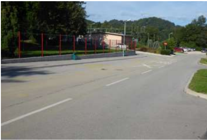
Avtobusna postaja, obračališče in začasno parkirišče