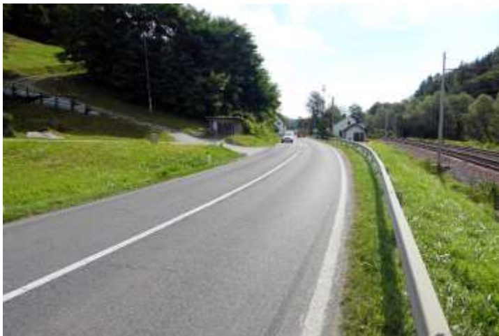
Nevaren odsek brez površin za pešce pri zaselku Loke