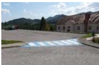
Označen prehod za pešce