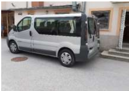
Prihod šolskega kombija pred šolo.