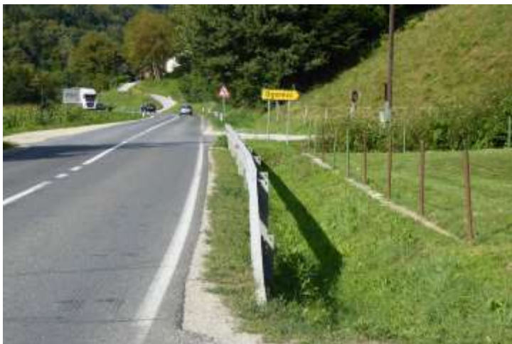
Prometna cesta pri odcepu za Ogorevc