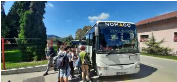
Odhod šolskih avtobusov izpred šole