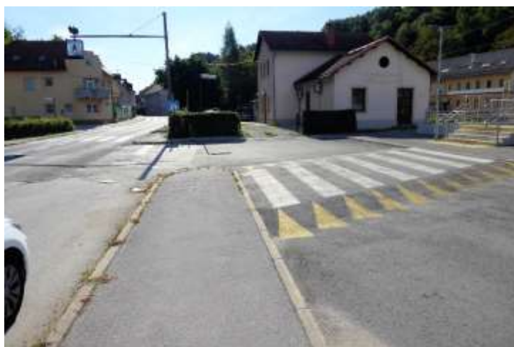
Prehod za pešce na zelo prometnem delu cestišča (levo)