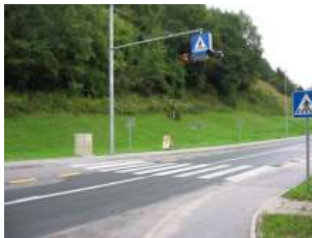
Nevaren prehod za pešce v Opoki; slaba vidljivost pešcev v jutranjem času ali slabih vremenskih razmerah