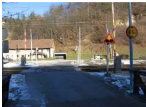
Železniški prehod Opoka