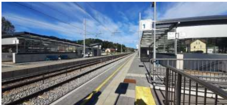
Na novo urejena železniška postaja s podhodi za pešce