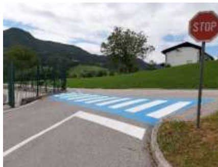
Dovoz in izvoz izpred šole.