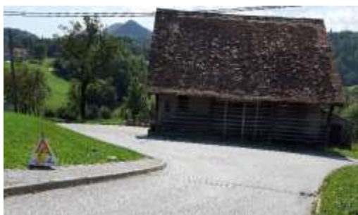
Nevaren odsek brez površin za pešce