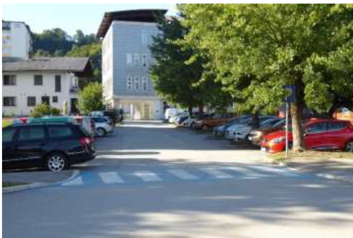
Dovoz k šoli – obvezna smer naravnost