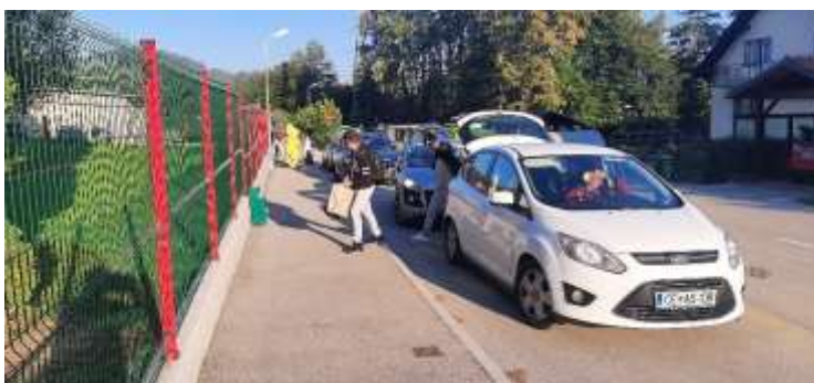
Zgoščen promet v jutranjih urah