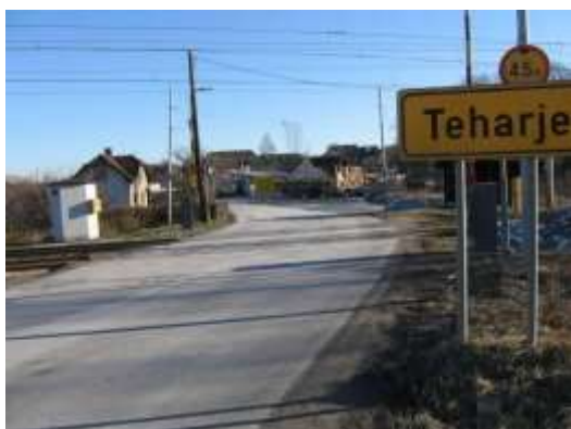
Železniški prehod Teharje