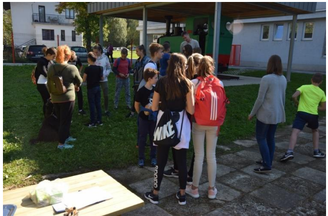
izhodiščna točka poti je lokomotiva pri šoli